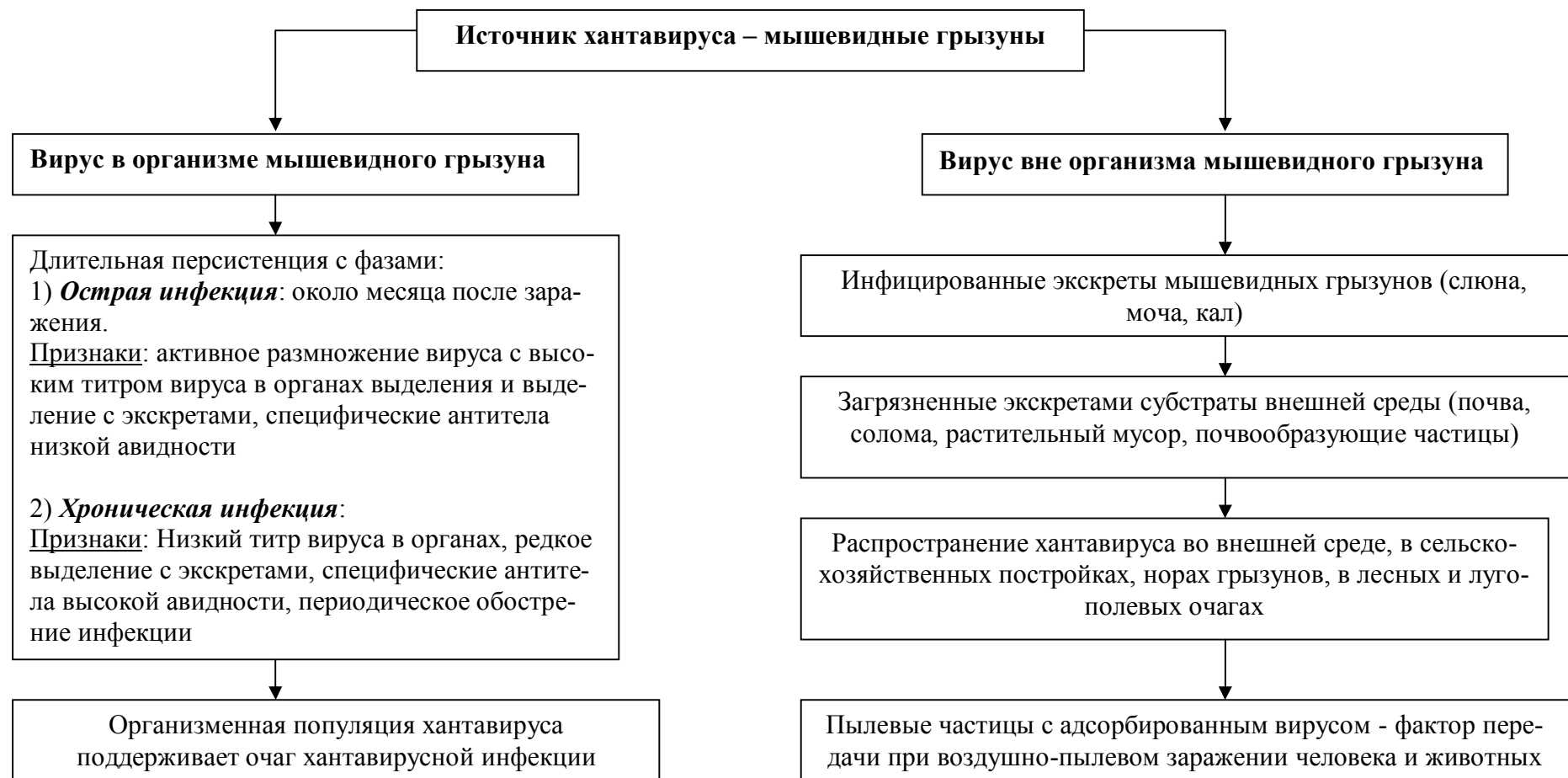
Рисунок 2. Концепция существования хантавируса в природных очагах инфекции